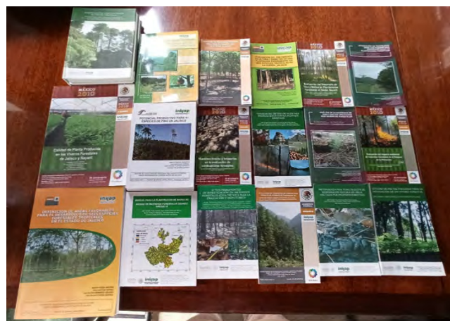
Material obtenido en donación del INIFAP