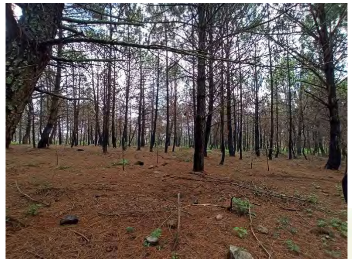
Panorama general de zona norte de Cerro Gordo en el municipio de San Ignacio Cerro Gordo