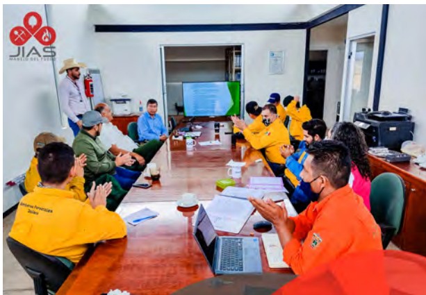
Aspecto General de Reunión Presentación PMF