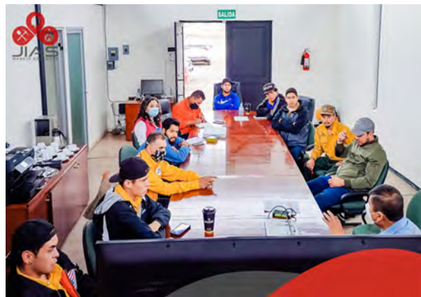
Aspecto General de Reunión Presentación PMF