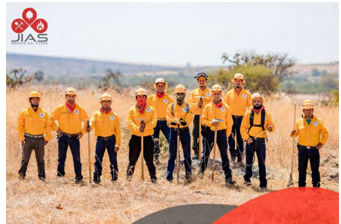
Brigada Regional JIAS