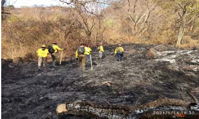
Brigada Regional en combate a incendio forestal en Acatlic, Jalisco

Recorridos de reconocimiento. Jesús María