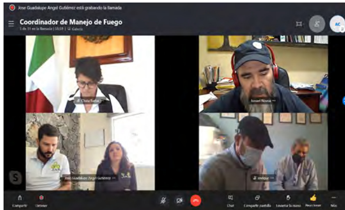
Sesión del Comité de Selección. Entrevista a candidatos puesto Coordinador Manejo de fuego