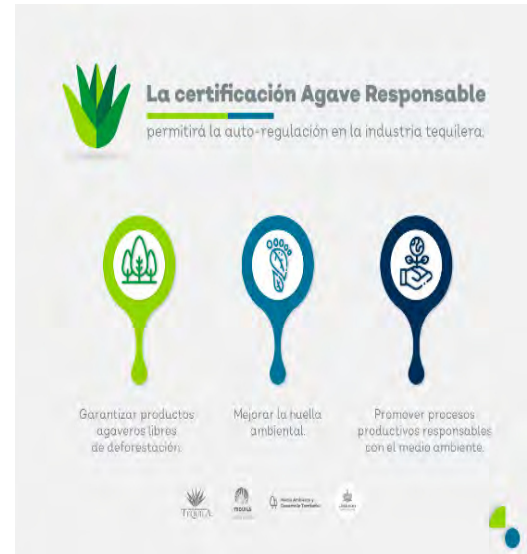
Propaganda sobre certificación Agave Responsable