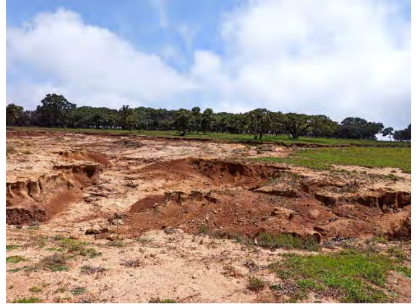
Predio con cárcavas en Jesús María incluido en propuestas de rehabilitación