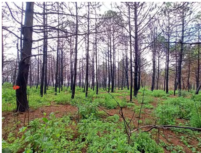
Predio impactado por incendio en Cerro Gordo en el municipio de San Ignacio Cerro Gordo