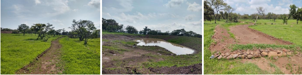
Figura 8. Zanjas en curvas de nivel con bordos que almacenan el agua de los escurrimientos.