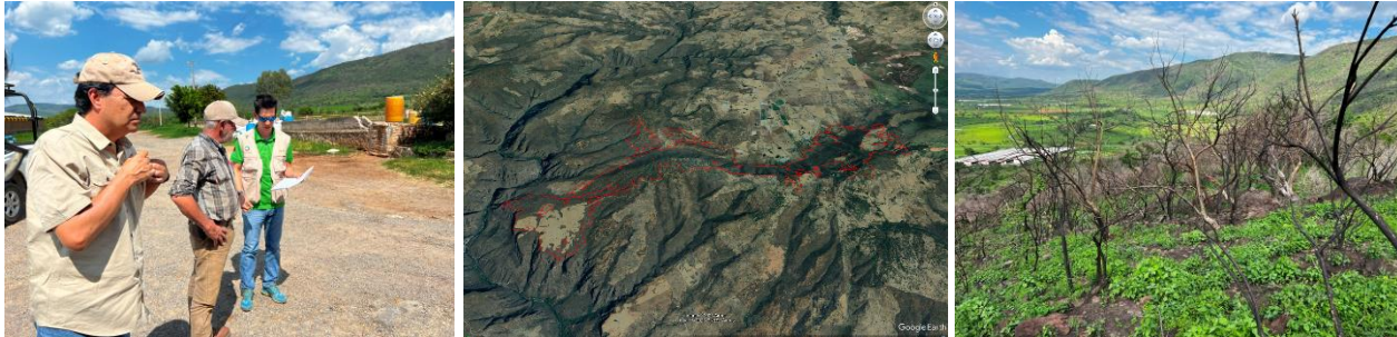
Figura 6. Visita de PROFEPA en áreas impactadas por incendios forestales en el Cerro de la Campana del municipio de Tepatitlán de Morelos.

El 02 de agosto PROFEPA realizó una visita de verificación en el Cerro de la Campana en Tepatitlán de Morelos, derivado de denuncias ciudadanas por incidencia recurrente de incendios en la temporada de estiaje. El jefe de manejo del fuego apoyo en el recorrido de campo en las áreas siniestradas. Se observó que con las primeras lluvias del año se está propiciando la regeneración natural de la vegetación. El personal de PROFEPA entregó al propietario una notificación que establece que no se podrá realizar cambio de uso de suelo en las áreas impactadas. Para complementar la información, se solicitó a SEMADET la superficie final impactada, la cual fue de 980.80 hectáreas de selva baja caducifolia y bosque de encino.