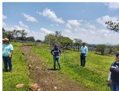
Figura 11. Visita de campo de personal técnico de Grupo Salinas y Heineken en el predio "Las Asules Lomas".

El predio fue propuesto para participar en la convocatoria de reforestación financiado por Grupo Salinas y Heineken. El 22 de agosto se recibió la visita del personal técnico para valorar el predio, sin embargo, el predio ganador para el financiamiento se encuentra en la APFF Bosque la Primavera, debido a las ventajas logísticas que tiene por su cercanía con la ciudad de Guadalajara.