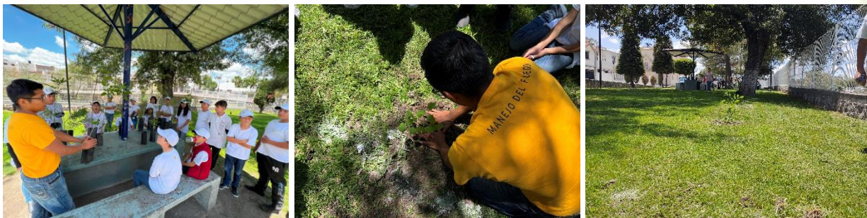
Figura 5. Reforestación social con alumnos del Encuentro Infantil de Alto Rendimiento "Emprendo y Aprendo" del DIF municipal de San Miguel el Alto.

En el mes de agosto se realizó una reforestación social con alumnos del Encuentro Infantil de Alto Rendimiento "Emprendo y Aprendo" del DIF municipal de San Miguel el Alto. La reforestación se realizó con árboles donados por el vivero regional JIAS. El jefe de manejo del fuego brindó la capacitación y asesoramiento a los niños para establecer la reforestación. Participaron 17 alumnos y se plantaron 24 árboles de diferentes especies (mezquite, palo dulce, fresno, colorín, tepehuaje, ceiba y paraíso).