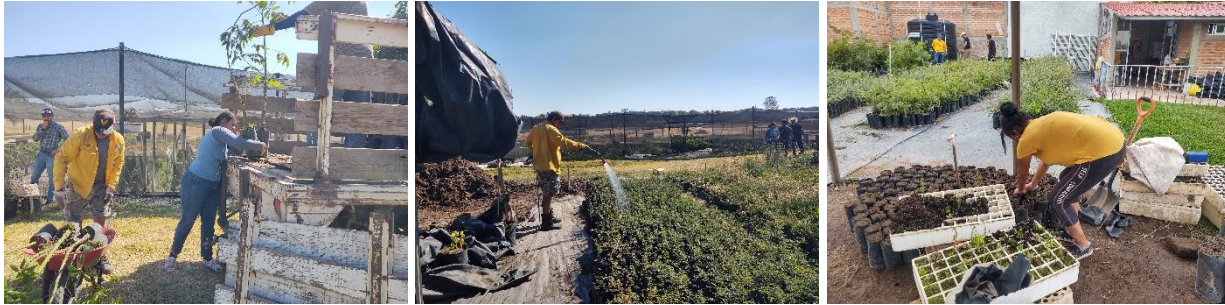
Figura 3. Apoyo de personal brigadista en actividades del vivero regional JIAS.

En este trimestre finalizó la contratación del personal brigadista programado. Los brigadistas colaboraron hasta la segunda semana de julio. Durante estos días apoyaron en el vivero regional JIAS en trabajos de preparación de sustratos, preparación de semilla, llenado de charola, riego, poda, deshierbe, trasplante y embolsado.