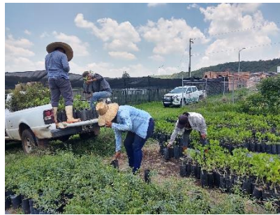
Figura 4. Personal brigadista contratado para apoyar en vivero JIAS.

Con el remanente resultante por operar la brigada con menor personal del programado, se contrató a tres brigadistas por un periodo de seis meses (julio-diciembre) para apoyar en actividades de producción de planta forestal en el vivero regional JIAS. Las principales actividades que realizaron en este trimestre, fue el deshierbe, trasplante, embolsado y recolección de semilla.