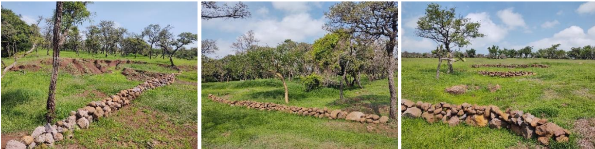
Figura 9. Barreras de piedras acomodadas en curvas de nivel para retener suelo y sedimentos.