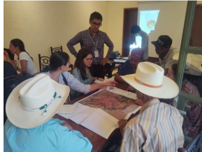
Figura 7. Taller informativo de consulta pública del “Programa de Ordenamiento Ecológico Territorial Regional de la Cuenca del Río Verde”.

El 09 de agosto el jefe de manejo del fuego participó en el taller para la consulta pública del “Programa de Ordenamiento Ecológico Territorial Regional de la Cuenca del Río Verde” celebrado en Yahualica de Gonzáles Gallo. El Programa abarca nueve municipios del territorio JIAS. Se realizó observaciones a la zonificación de las Unidades de Gestión Ambiental (UGAs) para vincularlas con las áreas prioritarias de incendios forestales del Programa de Manejo del Fuego de la JIAS.