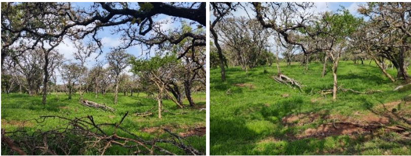
Figura 10. Barreras de material vegetal muerto en cacue de arrollo para disminuir el arrastre de sedimentos.

El predio fue propuesto para participar en la convocatoria de reforestación financiado por Grupo Salinas y Heineken. El 22 de agosto se recibió la visita del personal técnico para valorar el predio, sin embargo, el predio ganador para el financiamiento se encuentra en la APFF Bosque la Primavera, debido a las ventajas logísticas que tiene por su cercanía con la ciudad de Guadalajara.