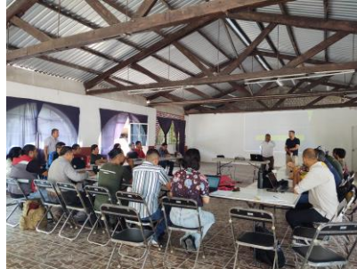
Figura 12. Reunión de Manejo del Fuego SEMADET-JIMAs en el Centro de Capacitación de Agua Brava, Bosque la Primavera.

Agua Brava, Bosque la Primavera. Al evento asistieron directivos del área de recursos naturales y manejo del fuego, para presentar el cierre y resultados de la temporada de incendios forestales 2023, así como el programa de acciones de restauración forestal y monitoreo del territorio pos-incendios. Por último, se contó con un espacio para exponer los resultados por región y Junta, así como las propuestas de mejora para el próximo año.